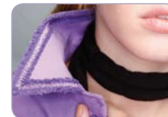
Toller Franseneffekt mit dem PFAFF® Chenille Fuß.

*Modell PFAFF® ambition™ 1.5, ausgestattet mit hochwertigem Tastbildschirm. Modell PFAFF® ambition™ 1.0 mit hochauflösendem Display.