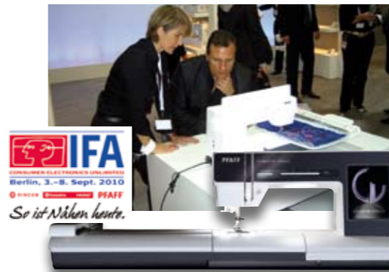
Guido Maria Kretschmer entdeckte die PFAFF® creative vision™ auf der IFA und war begeistert.