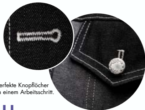
Perfekte Knopflöcher in einem Arbeitsschritt.

Nähanleitung für die Bluse und Jeansjacke www.pfaff.com