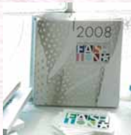
Bild oben: THE FASHION DESIGN AWARD ist inzwischen schon weit über Europa hinaus bekannt.

Bild oben: Besucher in der ersten Ausstellung im createurope-Showroom in Berlin-Friedrichshain.