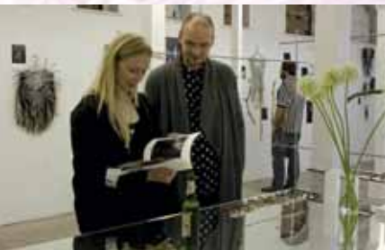
Bild oben: Besucher in der ersten Ausstellung im createurope-Showroom in Berlin-Friedrichshain.