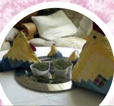
Bild links: Schick in Schale – die Hühner machten das Rennen.